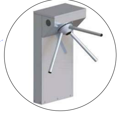
3- Akıllı Otomatik Turnike Sistemi Opsiyonu