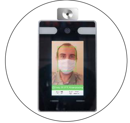
2- Kızılötesi Yüz Tanıma ve Maske Kontrol Sistemli Termometre Opsiyonu