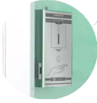
Temassız El Dezenfektanı (5 lt)