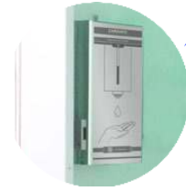
Temassız El Dezenfektanı (5 lt)