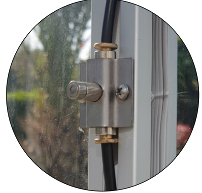
1- Otomatik Sisleme Sistemi Opsiyonu 0,10mm Nozul 0,15mm Nozul