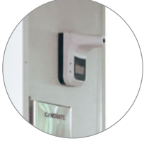
Kızılötesi (Infrared) Termometre