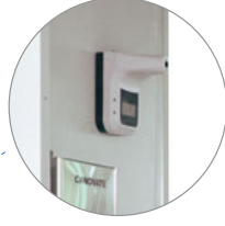
Kızılötesi (Infrared) Termometre