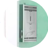
Temassız El Dezenfektanı (5 lt)